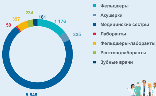
Численность среднего медицинского персонала, человек