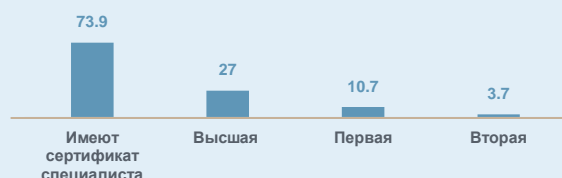
Распределение численности врачей по квалификационным категориям, %