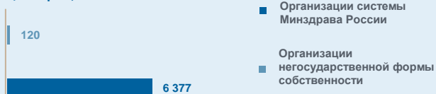
Число больничных коек круглосуточных стационаров, всего