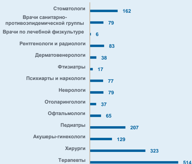
Численность врачей всех специальностей, человек